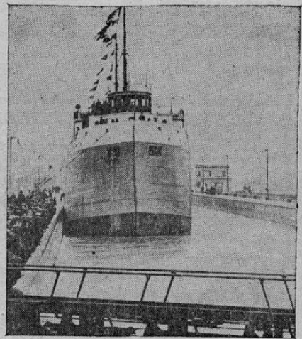
Acaba de ser inaugurado en Canadá el canal Welland, que permitirá el paso de barcos de gran calado del lago Ontario a los otros grandes lagos. Dicho canal ha costado ciento veinte millones de dólares. La foto muestra la ceremonia inaugural, con el barco Georgia atravesando el canal por primera vez.