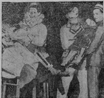
La Cruz Roja Americana organizó hace poco una función de circo para los niños inválidos hijos de veteranos de la guerra, proporcionándoles así un día de completa felicidad. La foto muestra a varios de esos niños llegando al circo en brazos de sus amigos los clowns.