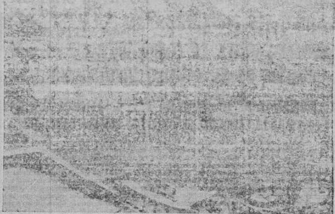
La foto nos da idea de los estragos causados por el reciente incendio de Singalong, distrito de Manila, a consecuencia del cual quedaron sin hogar tres mil personas.