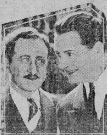
REGINALD DENNY (Right) and ROLFE SEDAN in a scene from "ONE HYSTERICAL NIGHT" A UNIVERSAL PICTURE

Nuestro público es un fervoroso admirador del gran actor REGINALD DENNY quien tiene el merito de ofrecer unas películas míticas tan divertidas y sugestivas que naturalmente proporcionan al público minutos de gran satisfacción.