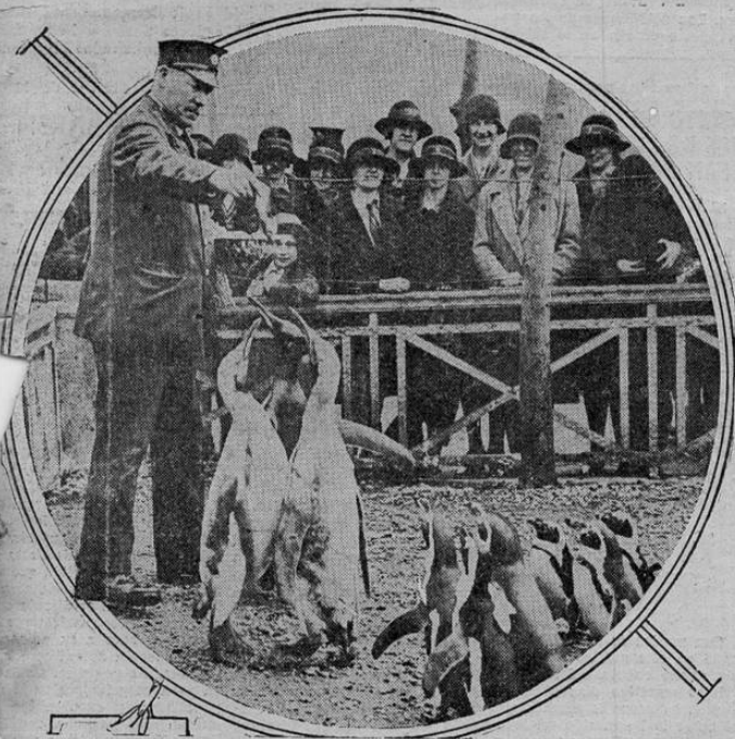
Por arrebatar un pez de las manos del guardián, los pingüinos del jardín zoológico de Londres ejecutan una verdadera polka, con gran regocijo de las espectadoras